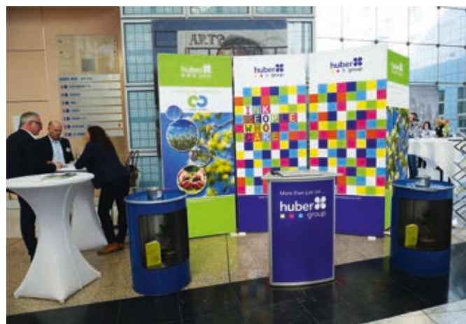
Links: Digitalprint Garbsen zeigte die vielen Möglichkeiten zur Personalisierung. Oben: Das OPS 2018 fand wie schon 2017 im Hilton Hotel am